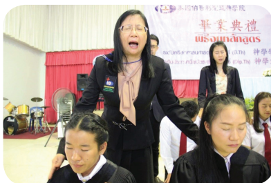
老師為畢業生作差遣禱告