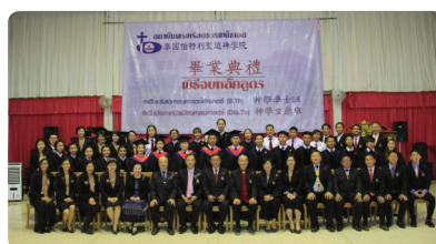
伯特利聖道學院在19/03/2021年舉行的畢業典禮